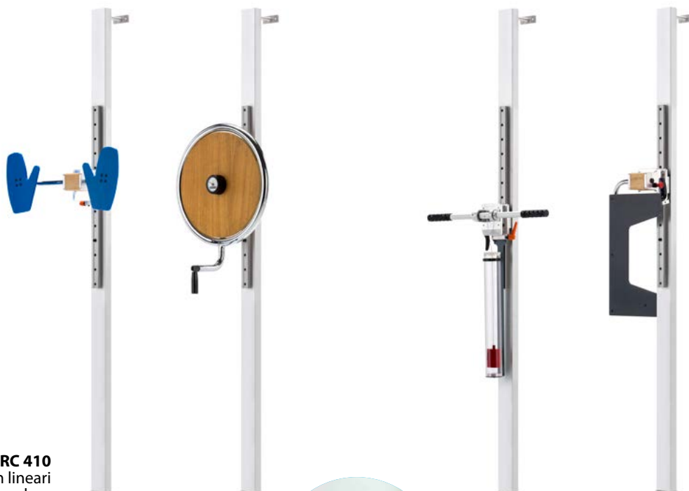
PARC 410 3m lineari di ingombro.

tale che, anche i movimenti PARC, finalizzati alla prevenzione e allo scarico della fatica muscolare, possano rientrare nel ciclo lavorativo.