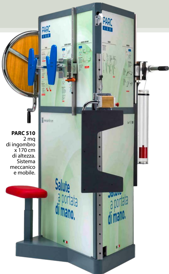
PARC 510 2 mq di ingombro x 170 cm di altezza. Sistema meccanico e mobile.

PARC 510 è una struttura mobile su cui sono collocati cinque attrezzi ergo-